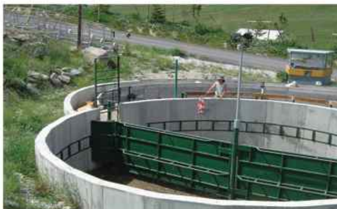
Parc de contention circulaire sur l'alpage d'Huez permet de mobiliser l'instinct de fuite des animaux.

En raison des très grands espaces parcourus, de l'éloignement entre l'homme et l'animal, le pâturage des alpages et des parcours réclament une docilité des troupeaux sans faille. Pour ne pas être traumatisante et ne pas défaire le fragile lien entre l'homme et les bêtes, les dispositifs de contention doivent permettre à une seule personne de soigner, trier, traiter un animal sans le brusquer, voir en améliorant sa confiance envers l'homme. Des matériels de contention adaptés et bien positionnés doivent être mis en place en tenant compte des cinq sens des animaux.